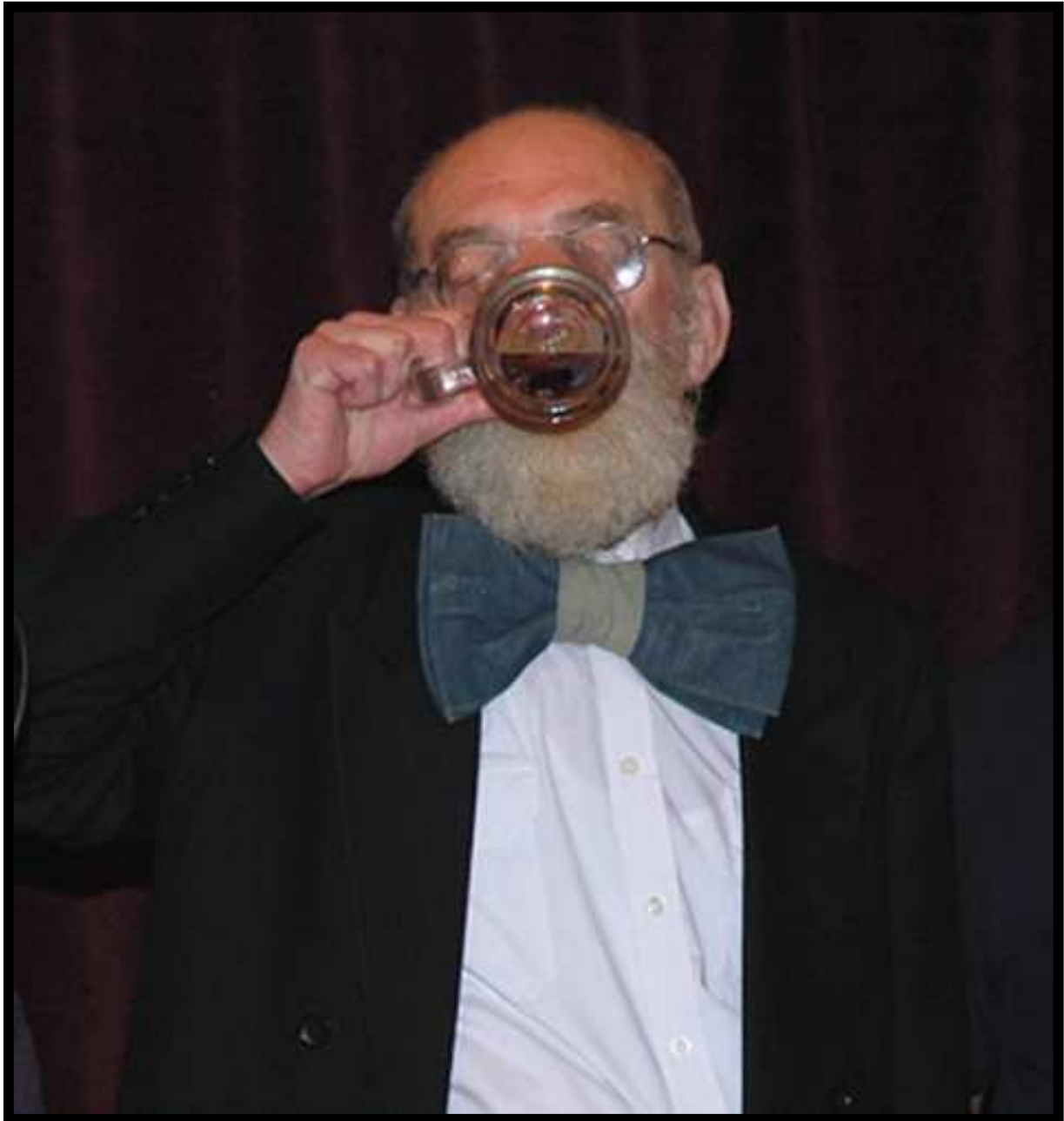
Sólo: s pivem / vlastně také častá dvojice...