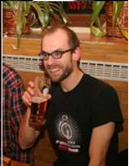
Ze života Kobry: za mlada i za stara, ve Znojmu i jinde. Se ženou R a se synem L...