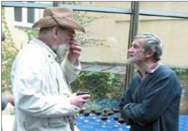
Dvojice: s Hanousekem / aneb dva dědci českého „KrHu“

Škrt: Už to zaznělo v úvodu, ale zasluhuje si samostatné heslo / Kobra otiskl v magazínu přes tisíc vtipů více než stovce autorů... A zadlužil se kvůli tomu!