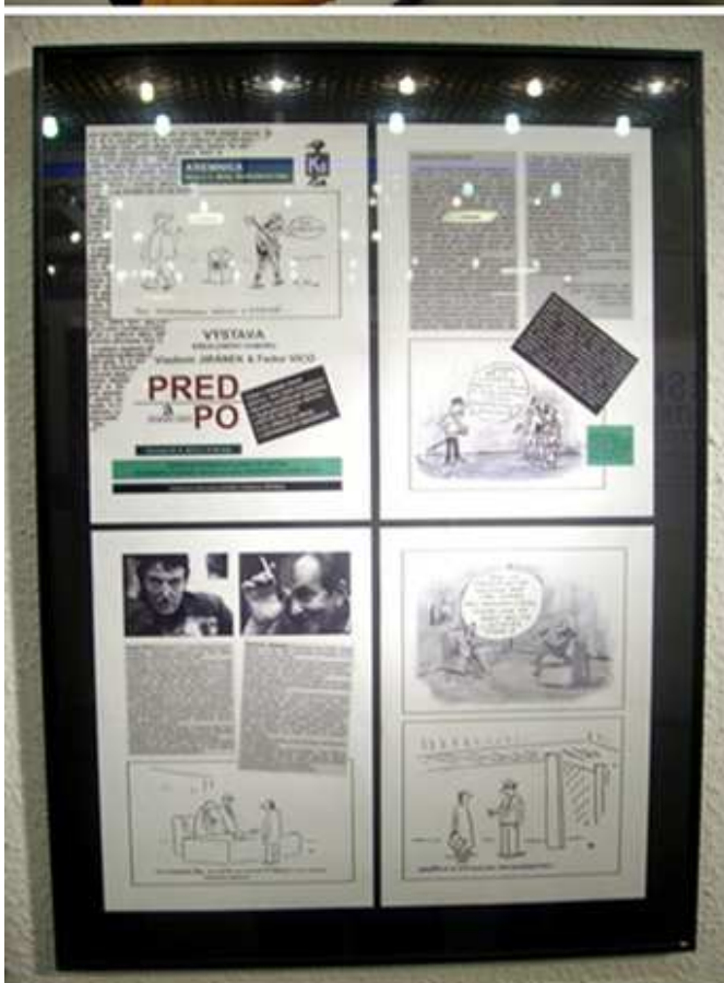
Na dolní fotce je v jednom ze sklenených panelů vystaven tenký, ale pěkný a hlavně tištěný katalog, který k výstavě připravil Fedor Vico