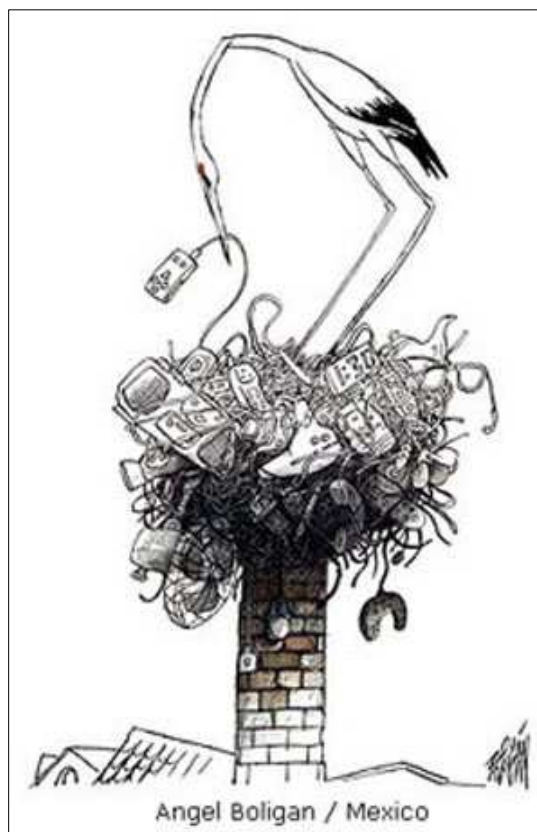
Angel Boligan / Mexico