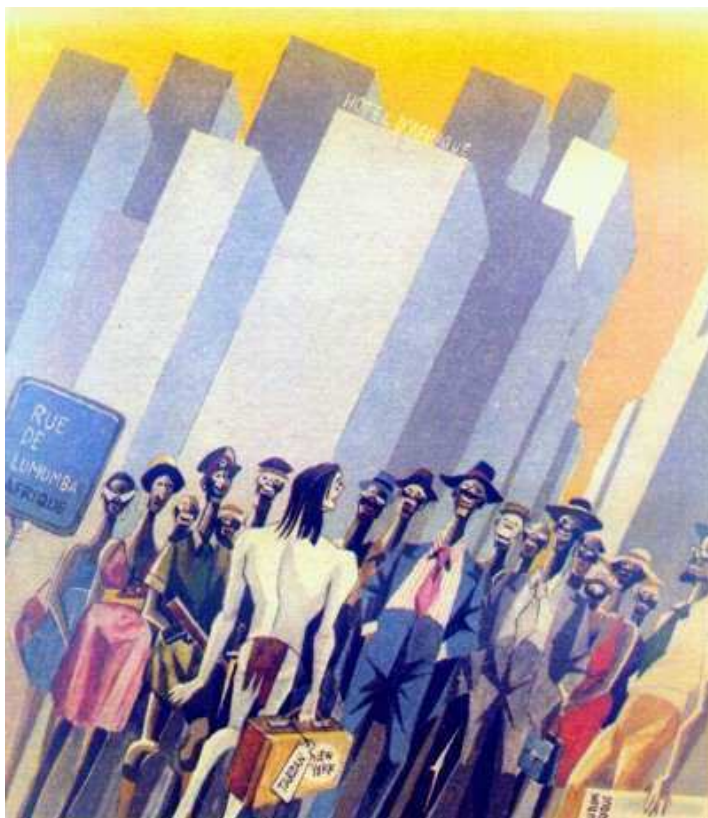
Kresba vlevo: Turhan Selçuk (Turecko) - k nekrologu v tomto čísle