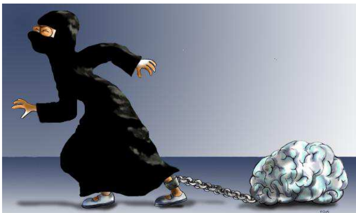
Kresba: Adriana Mosquera - Kolumbie

To u současných pokusů kolegy Lubomíra Vaňka v České republice nehrozí. Čtenáři GAGu si to mohou ověřit na dalších stranách tohoto čísla, kde kvartet těchto podobizen uveřejňujeme.