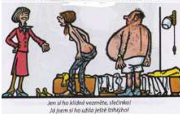
Jen si ho klidně vezměte, slečinko! Já jsem si ho užila ještě šňáhově!