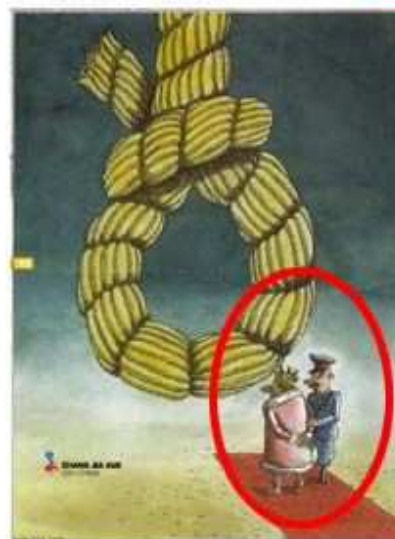
Zhang Jia Xue - 2005 Nasreddin Hodja Contest