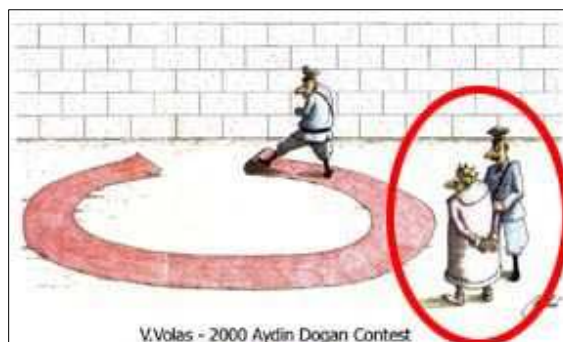
V. Volas - 2000 Aydın Dogan Contest

Něco nevysvětlitelného - alespoň z pohledu autora našeho civilizačního okruhu: Číňani si z prvního obrázku „vypůjčil“ dvě figurky - krále a důstojníka. To, na co jsme si už v této rubrice zvykli, totiž, že si autoři občas uzmou (nebo nevědomky přisvojí) nápad někoho jiného, tu neplatí! Kdesi jsem četl, že taoismus (či co to tak v Orientu určuje pravidla) má úplně jiné pojetí duševního vlastnictví než křesťanství. Takže Korejci, Vietnamci a také Číňani nechápou naše rozhořčení s plagiátorství aut, bot, léků, rádií či tepláků. A už vůbec ne muziky, filmů a teď tedy také „značkových“ obrázků. (iha)