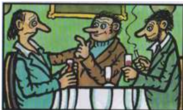
Na co ty, prosím tě, sháníš pornokazety? Stačí když se teď nečekaně vrátíš z hospody domů!

Obrázky v knize /je jich 130/ jsou jak barevné, tak s jednou doplňkovou barvou, tak čistě černobílé /obvykle ty bez pozadí, jen dvou - pardon - spíš tří figurek/. Soudím, že ty nebarevné byly většinou určeny redakcím deníků (Kvítko) a ty s modrou doplňkovou mi připomínají Dikobraz z dob, kdy měl některé stránky tištěné právě takto. Stran je 88, z toho plyne, že většinou jsou vtípy na stránkách po dvou, někdy po jednom. Obálkový vtíp je k vidění též uvnitř,