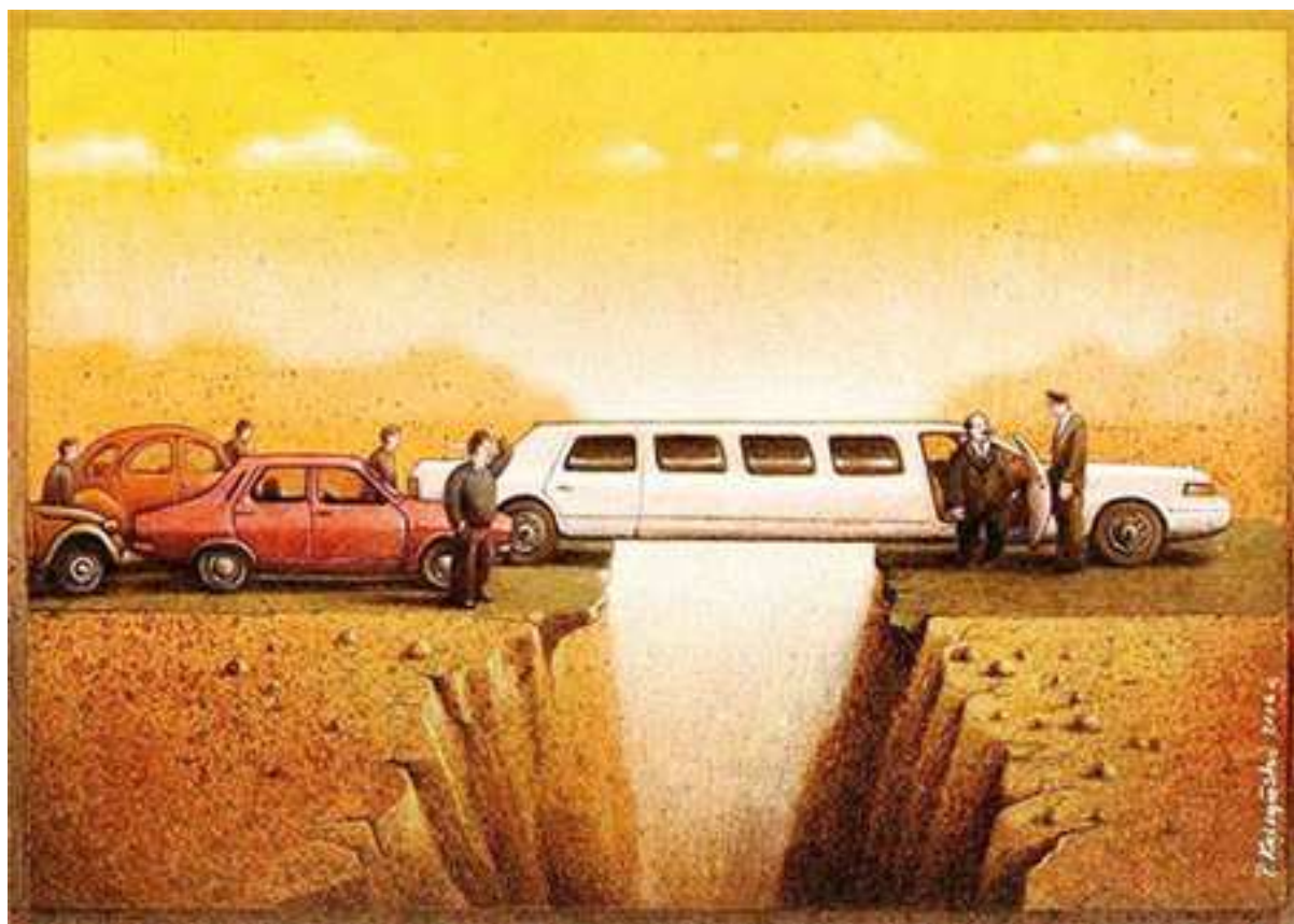
Kresba: Pawel Kuczyński, Polsko - přijal pozvání města Písek na CMP 2008 v září