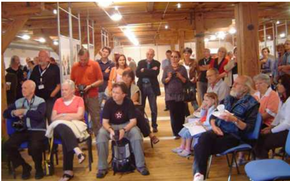
Na snímku: Nízké trámy - výstižné je pojmenování nové výstavní síně ve 3. patře Sladovny v Písku. GAG-foto ukazuje publikum během vernisáže výstavy CMP 2008