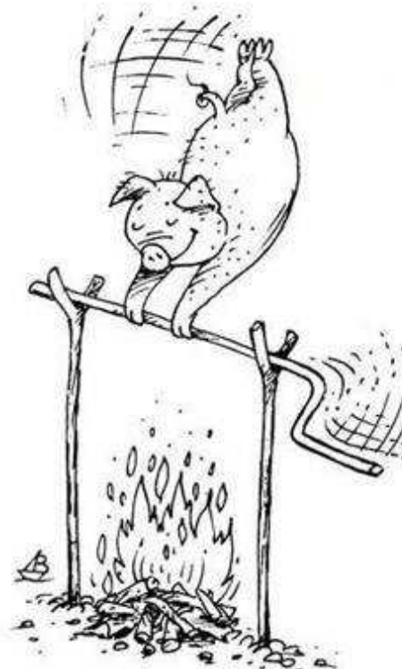
2006 - V. Dubinin