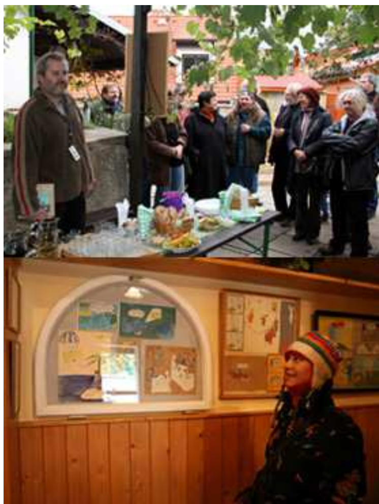
návštěva pátečního koncertu bubeníků Bu-ší-do.